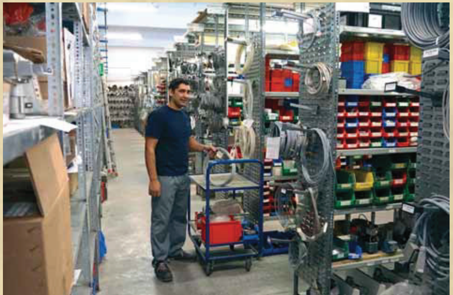
Ein zentrales Teillager mit rund 10 000 Einzelpositionen ist die Basis für den Anlagenbau und eine rasche Reparatur von Verschleiß- und Störfällen.

Reinhard Bauer – Technokomm E-Mail: office@technokomm.at