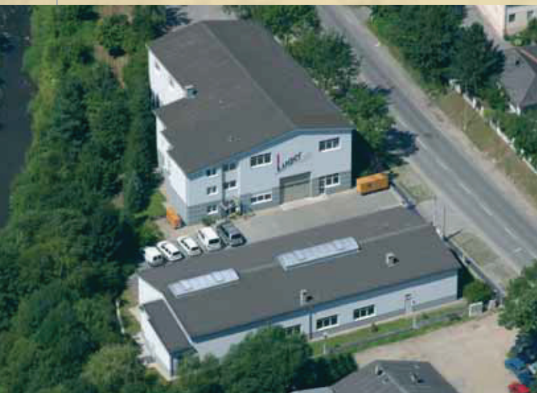
Die 1987 neu gebaute Luger-Firmenzentrale in Purkersdorf bei Wien. Von hier aus werden Kunststoffmaschinen und gesamte Verarbeitungssysteme in die Länder Österreich, Ungarn, Tschechien und die Slowakei verkauft und gewartet.