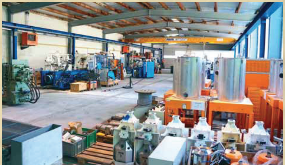
Das Luger -Leistungsangebot umfasst über den Maschinenverkauf hinaus die Überholung von Gebrauchtmaschinen.